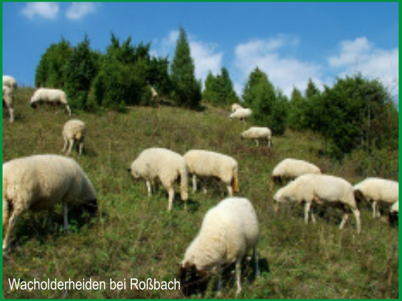
Wacholderheiden bei Roßbach

Die Gesamtlänge, der verschlossenen und nicht zugänglichen Roßbachponorhöhle, beträgt 25,3 Meter bei einer Tiefe von 7,2 Metern. Die Höhlengänge sind sehr flach und meist nur kriechend zu bewältigen. Ein seltener Bewohner der Höhle ist der Höhlenflohkrebs.